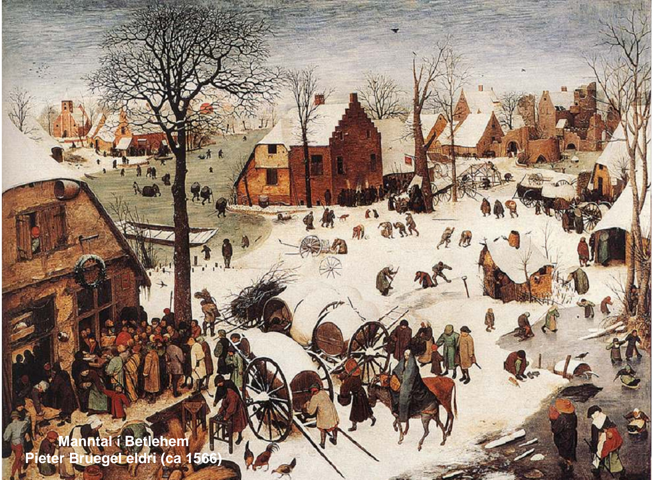
Manntal í Betlehem Pieter Bruegel eldri (ca 1566)