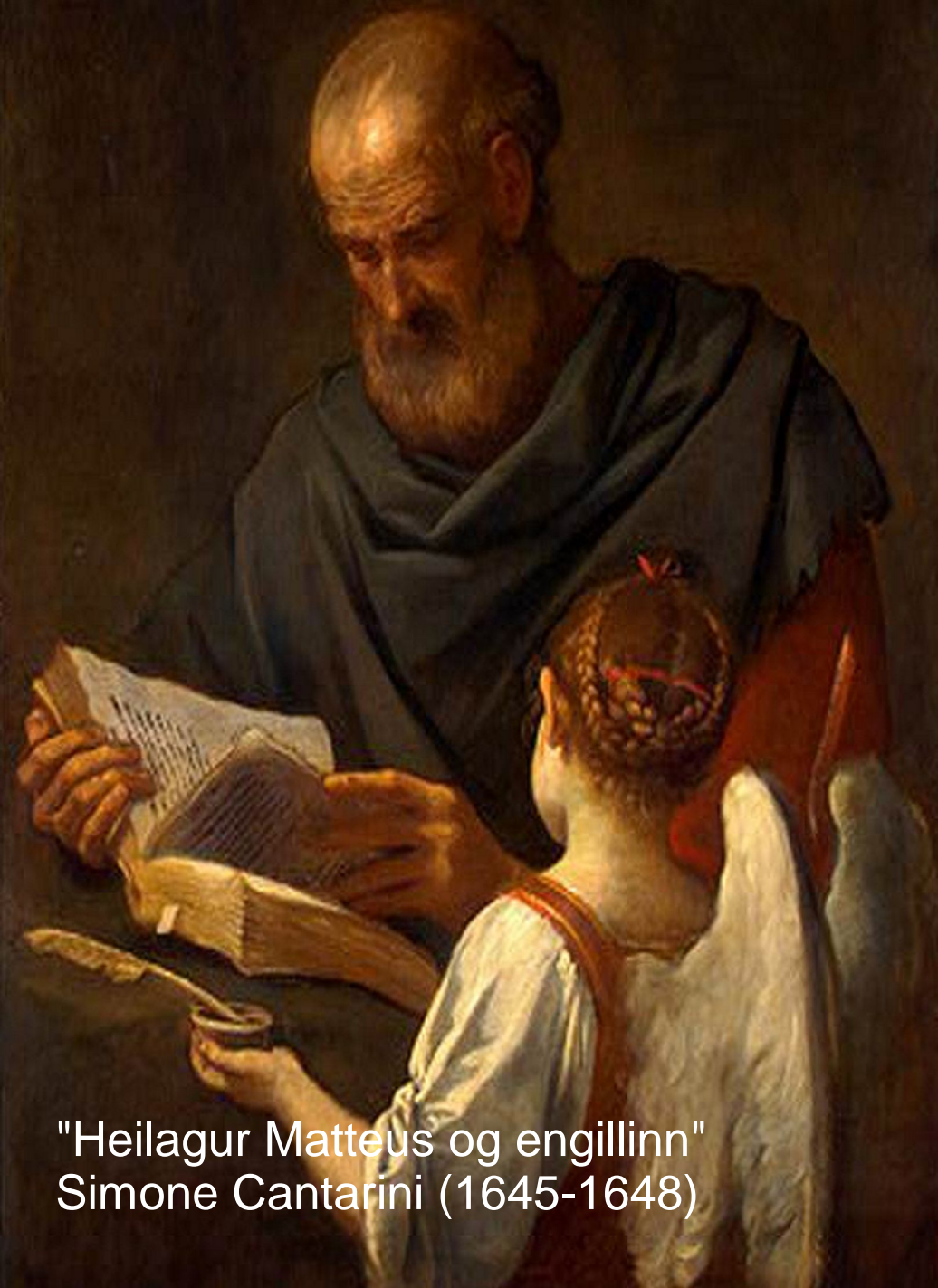
"Heilagur Matteus og engillinn" Simone Cantarini (1645-1648)

Frumkristnir töldu sjálfir svo vera. Matteus var greinilega gyðingur með fræðilegan bakgrunn - öfugt við Markús sem virðist hvorki þekkja staðhætti í Palestínu né ýmislegt varðandi Gyðingdóm.