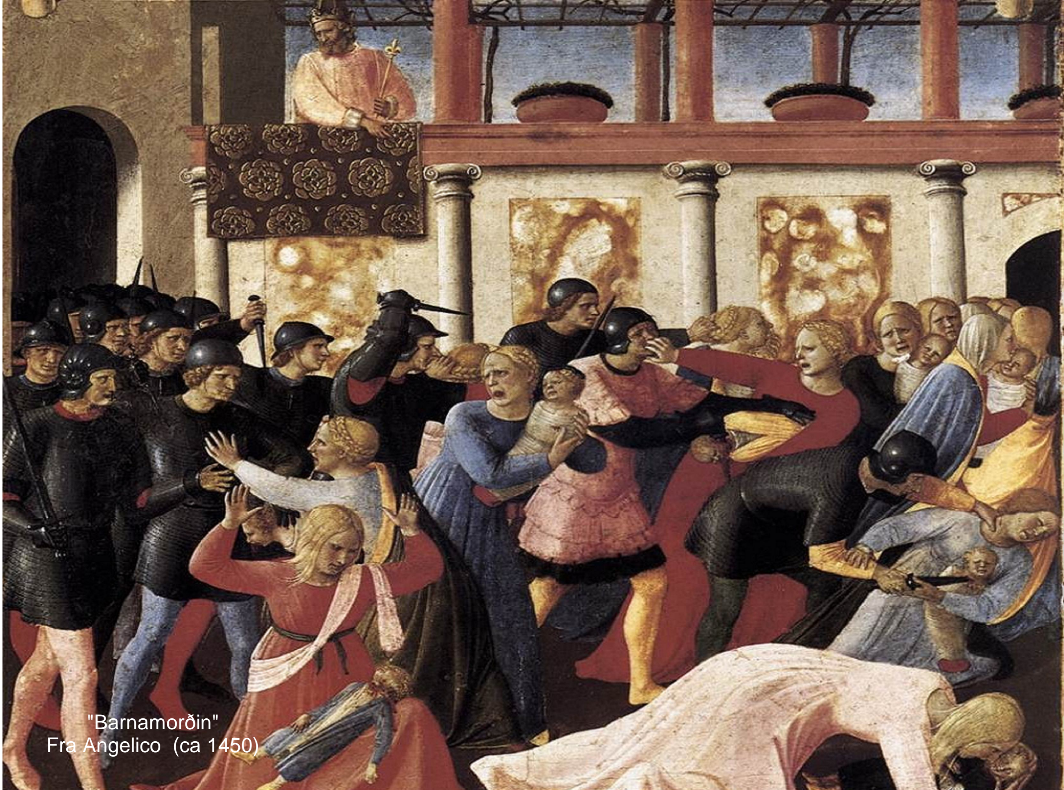
"Barnamoroin" Fra Angelico (ca 1450)