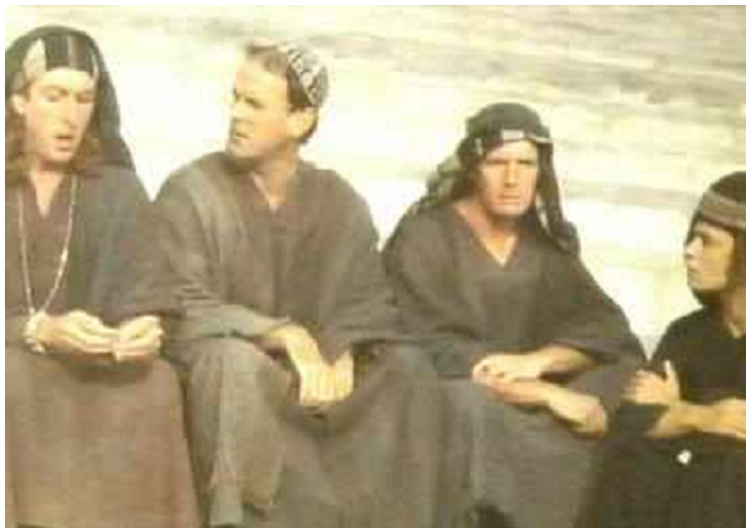
Úr "Life of Brian" eftir Monty Python (1979)

Jósefus sagnaritari segir frá einum Jesúsi sem gekk um Jerúsalem og spáði fyrir um eyðingu hennar. Sá var yfirheyrður af æðstuprestum og landstjóra, hýddur en sleppt lausum að lokum og dæmdur vitleysingur.