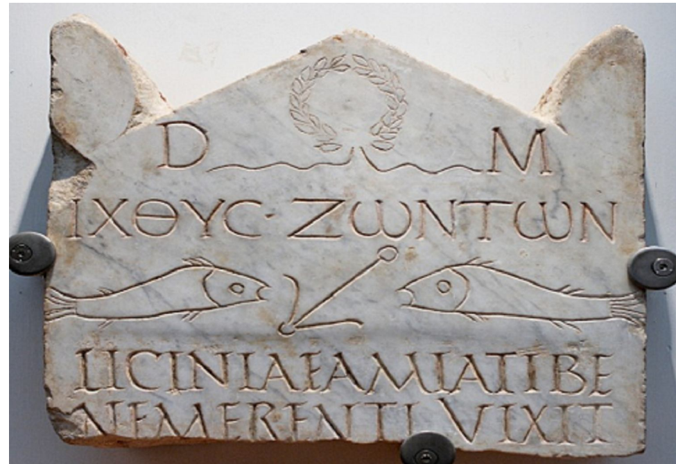
Fiskur lífsins - upphaf 3. aldar.