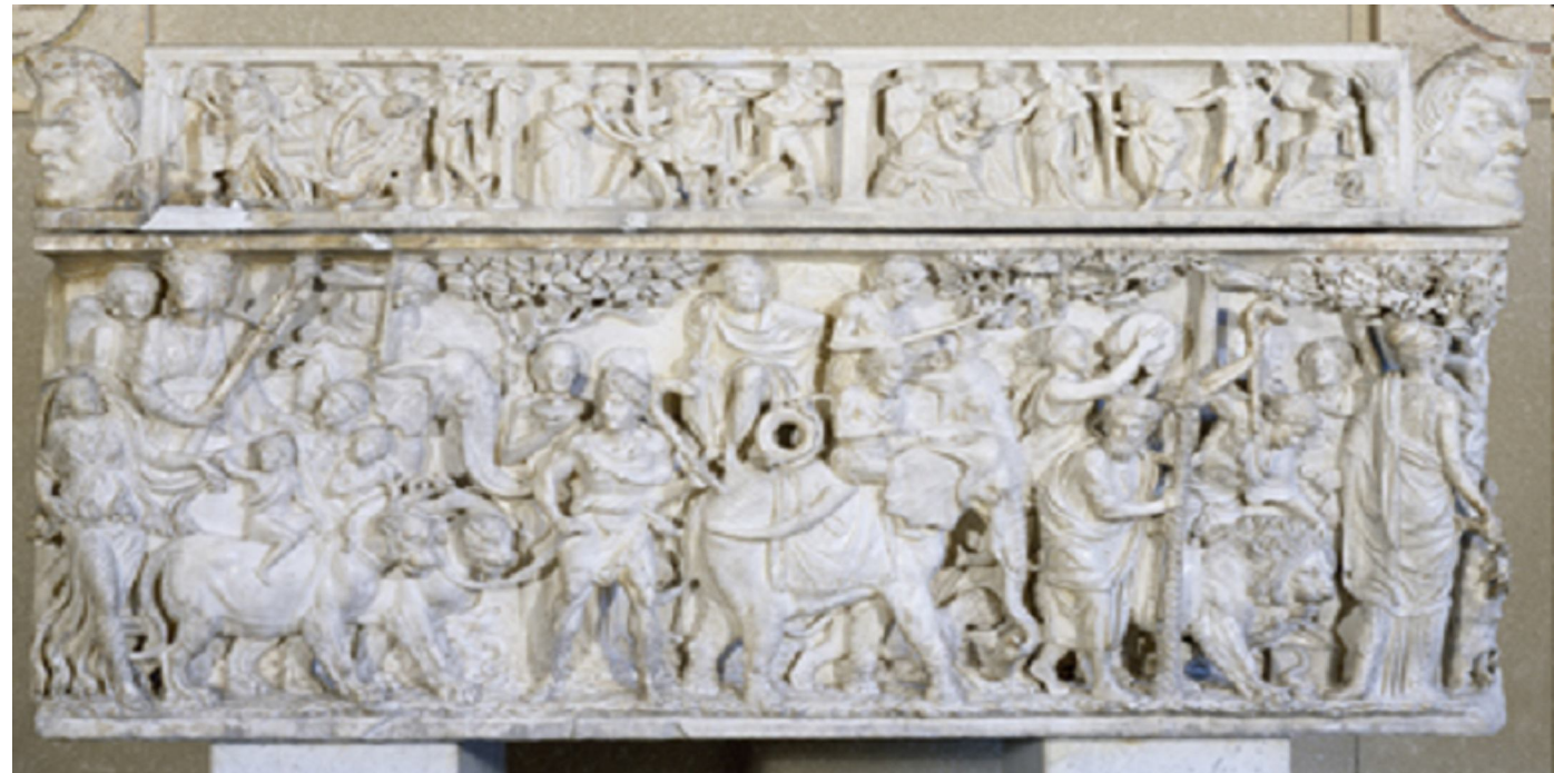
Sigurganga Díónýsusar. Rómversk kista, upb. 190 e.o.t.

Krossinn (ankh) táknar "líf" hjá Egyptum.