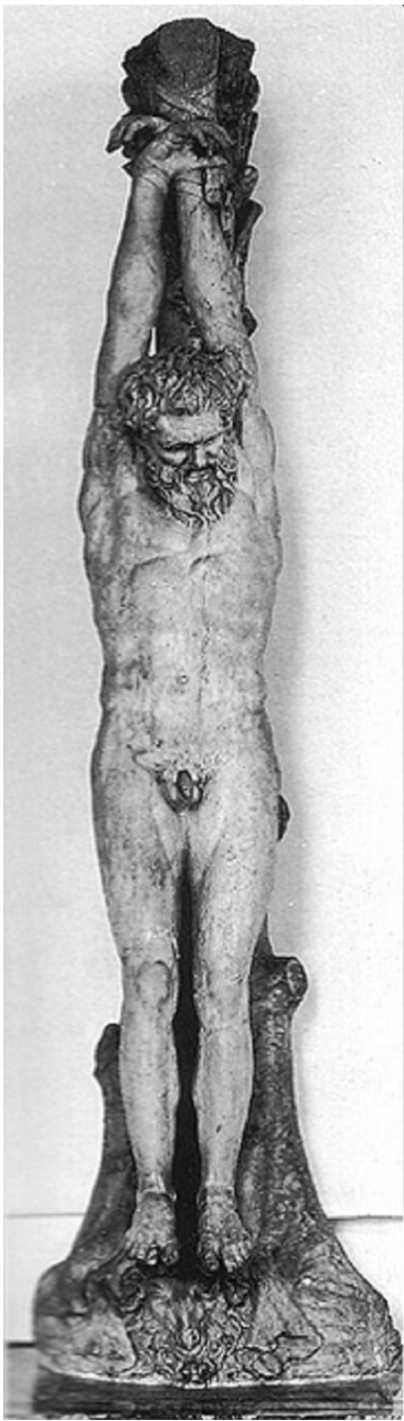
250-200 f.o.t. Louvre safnið Bakkus?

Samkvæmt NT var Jesú hengdur í staur ("stáros" á grísku). Krossfestingar voru af ýmsu tagi, ýmist með eða án þverslár, I, T eða X-laga.