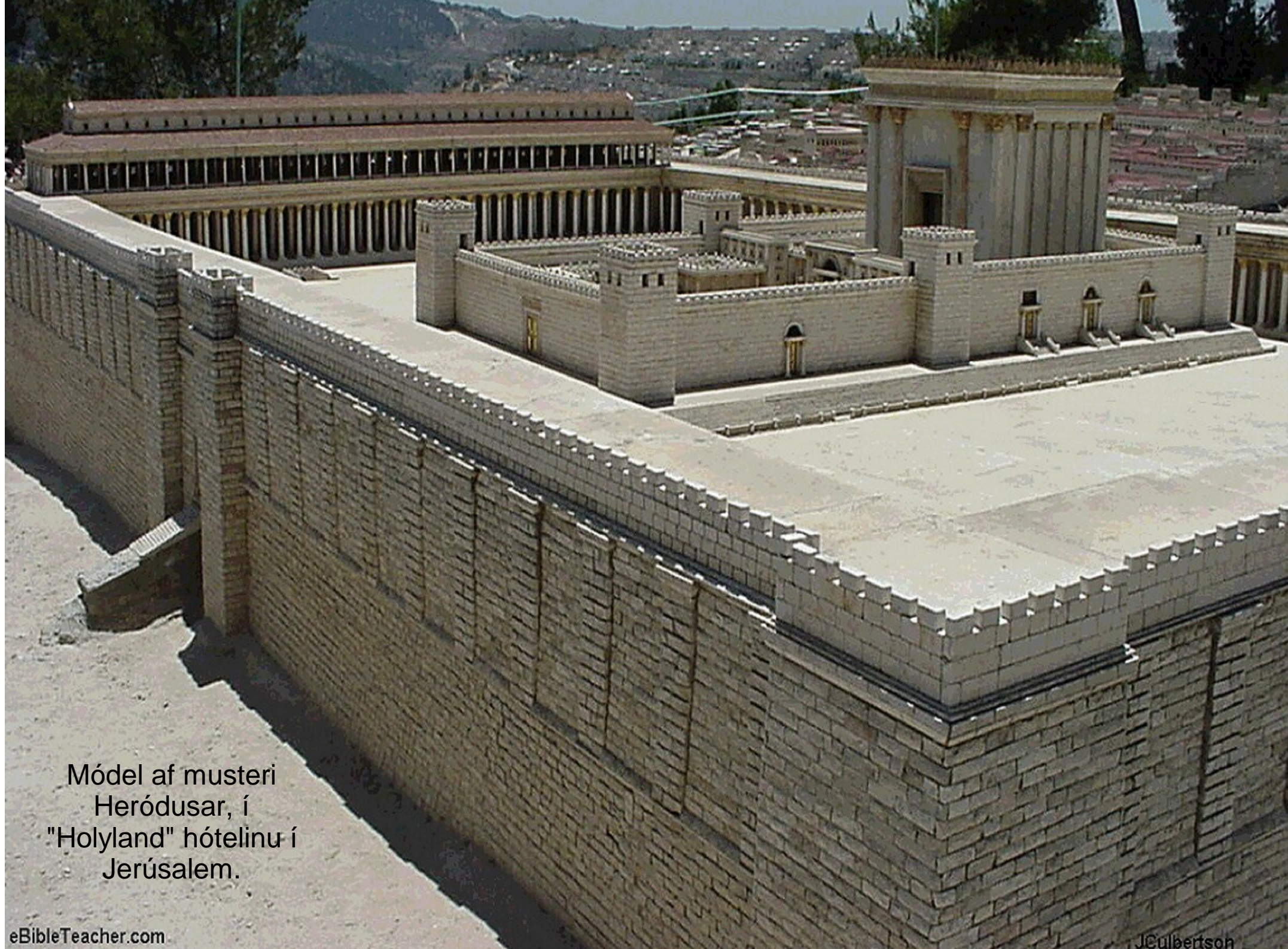
Módel af musteri Heródusar, í "Holyland" hótelinu í Jerúsalem.