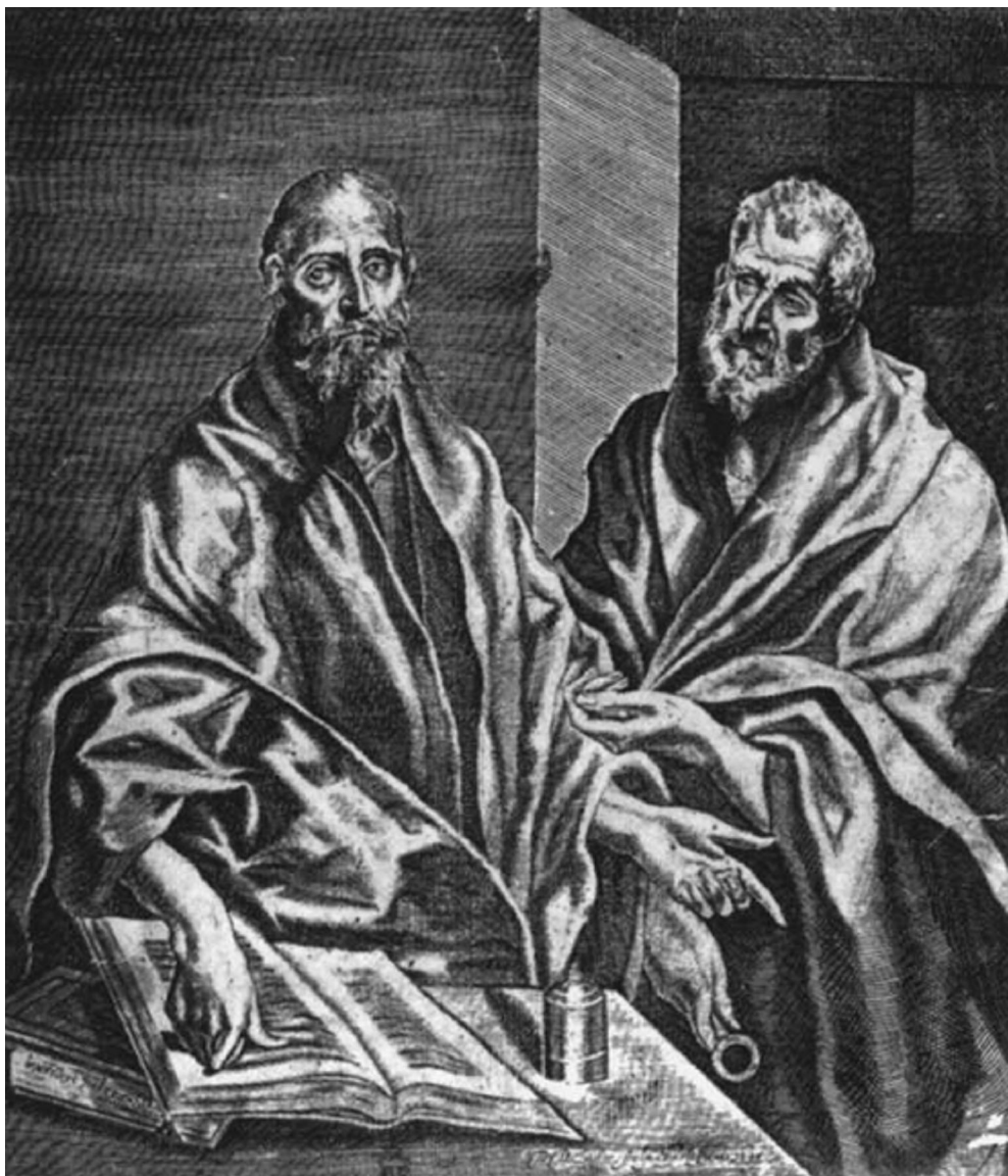
"Pétur og Páll", Diego de Astor, 1608

Pálsbréfin eru elsti hluti NT (49-55) og frumheimild, skrifuð af þátttakanda í atburðum.