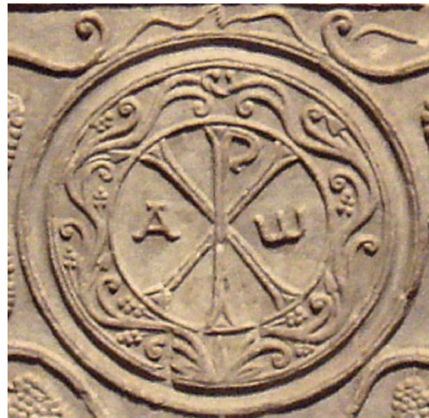
Chi-roh, merki Konstant- ínusar.