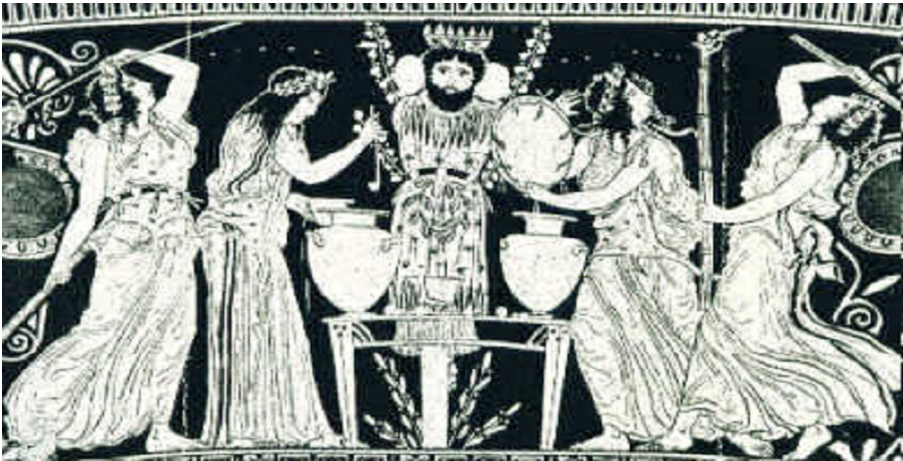
Grískur vasi, 5. öld f.o.t.

"... it hit me like a ton of bricks when I realized, after studying much previous research on the question, that virtually every story in the gospels and Acts can be shown to be very likely a Christian rewrite of material from the Septuagint, Homer, Euripides' Bacchae , and Josephus." (The Quest of the Mythical Jesus)