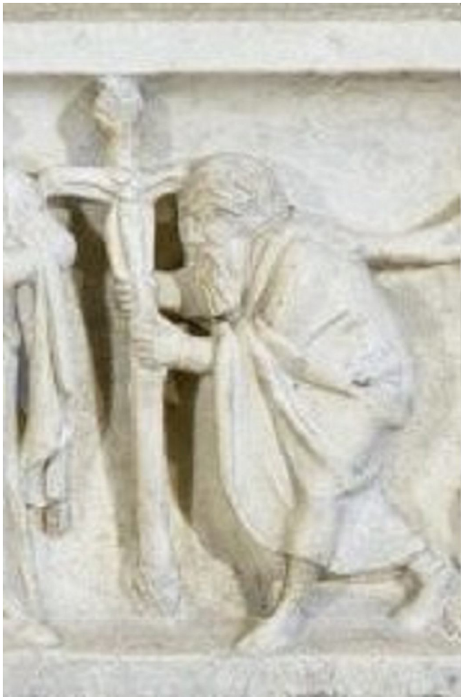
Efra vinstra horn kistunnar frá fyrri glæru. Diónýsus krossfestur?